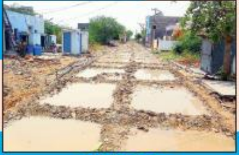
భాగవతి వంగుల కాంపౌండ్ బయ్యారాంతం ముగిసిన స్థలం పూర్తి