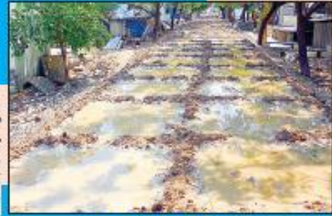
బుడగ బుగల కాంపౌండ్ బయ్యారాంతం ముగిసిన స్థలం పూర్తి