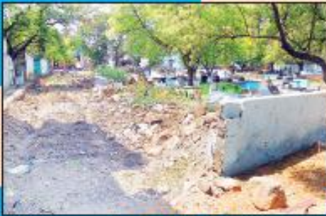
కాంపౌండ్ వాల్ నిర్మాణం పూర్తి కాకుండా కాంపౌండ్ వాల్ నిర్మాణం పూర్తి

ఉన్న మున్సిపల్ స్థలాలు అన్వయం చేయడం కోసం గాంధీనగర్ గాంధీనగర్ వార్డును నిర్మిస్తున్నారు. 14వ అర్ధిక సంఘం నిధుల కింద ఒక్క కాంపౌండ్ వాల్ రూ.10 లక్షలు బోర్డును చెల్లిస్తున్నారు. ప్రస్తుతం ఈ కాంపౌండ్ వాల్ నిర్మాణంలో ఉన్నాయి. అలాగే పట్టణంలోని బుడగ బుగల కాంపౌండ్ ఎస్టి, ఎస్టి నల్లపాన నిధులతో రూ.10 లక్షల వ్యయంతో ఒక సిసి రోడ్డు మరో రూ.3.50 లక్షల వ్యయంతో మరో సిసి రోడ్డు నిర్మిస్తున్నారు. ప్రస్తుతం ఇవి పూర్తి చేయడం చేయబడుతున్నాయి. అలాగే పట్టణంలోని పాతకాలనీలో క్రీడాలయ కళ్యాణ వారికకు రూ. 14వ అర్ధిక సంఘం నిధుల కింద రూ.10 లక్షల