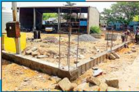
పట్టణంలోని గాంధీనగర్ ప్రాంతంలో ఇమాన్ మహల్ యువశాఖ కట్టడ ముగిసిన స్థలం బయ్యారాంతం కాకుండా కాంపౌండ్ వాల్ నిర్మాణం పూర్తి

రూ.73 లక్షల వ్యయంతో వేగం ప్రింజుకున్న అభివృద్ధి పనులు