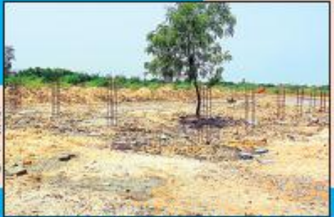
పట్టణంలోని టీడీపీ కళ్యాణ మండలం వమేపంలో ఉన్న ముగిసిన స్థలం బయ్యారాంతం కాకుండా కాంపౌండ్ వాల్ నిర్మాణం పూర్తి

ఉన్న మున్సిపల్ స్థలాలు అన్వయం చేయడం కోసం గాంధీనగర్ గాంధీనగర్ వార్డును నిర్మిస్తున్నారు. 14వ అర్ధిక సంఘం నిధుల కింద ఒక్క కాంపౌండ్ వాల్ రూ.10 లక్షలు బోర్డును చెల్లిస్తున్నారు. ప్రస్తుతం ఈ కాంపౌండ్ వాల్ నిర్మాణంలో ఉన్నాయి. అలాగే పట్టణంలోని బుడగ బుగల కాంపౌండ్ ఎస్టి, ఎస్టి నల్లపాన నిధులతో రూ.10 లక్షల వ్యయంతో ఒక సిసి రోడ్డు మరో రూ.3.50 లక్షల వ్యయంతో మరో సిసి రోడ్డు నిర్మిస్తున్నారు. ప్రస్తుతం ఇవి పూర్తి చేయడం చేయబడుతున్నాయి. అలాగే పట్టణంలోని పాతకాలనీలో క్రీడాలయ కళ్యాణ వారికకు రూ. 14వ అర్ధిక సంఘం నిధుల కింద రూ.10 లక్షల